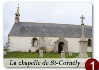
La chapelle de St-Cornély

Chapelle et église – habitat / Site archéologique de Mané Véchen / Landes, pinèdes et environnement maritime