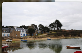
Port du Vieux Passage

Prendre à gauche et longer la pépinière d'eucalyptus. Franchir la route en direction de la chapelle du 18ème siècle de St-Cornély et la croix , au pied de laquelle on bénit les chevaux à l'occasion du pardon le deuxième dimanche de septembre. ① Aire de pique-nique.