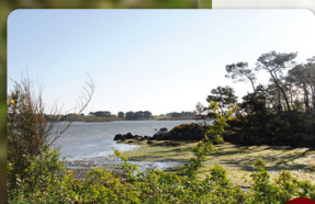
Lanse du Bisconte et ses prés-salés ou schorres

Passer sous le pont (en fonction de la marée) où vous aurez un point de vue remarquable sur les flots (réserve ornithologique protégée) et les courants marins très violents. Continuer vers la pointe du Bisconte vers la pointe de Beg er Vil (aire de pique-nique, plage et vue sur les flots) et l'anse du Bisconte et ses prés-salés ou schorres ⑤