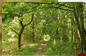
Le bois le dolmen

Traverser la route vers le sans-issu. Au croisement des 4 chemins, tourner à droite. A Pont-Mouton, traverser la route en franchissant le fossé et à 50 m tourner à droite sur le chemin qui vous ramène sur la route. 3 (à voir 40m face à vous dans le bois le dolmen)