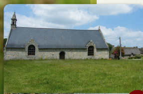
La chapelle Saint-Fiacre

Aller tout droit sur 20m et prendre à droite (observer à 300m à droite le grand menhir).